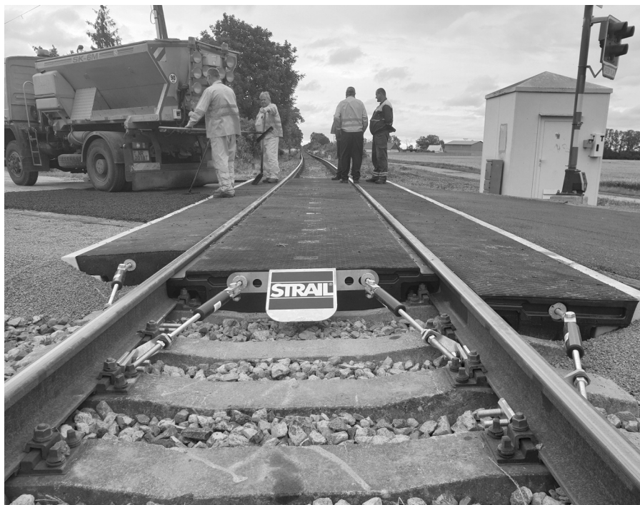
Železničné priecestie vo Veľkej Pake sa zrekonštruovalo v júni. V druhej fáze prác sa zabezpečí zvýšenie bezpečnosti premávky