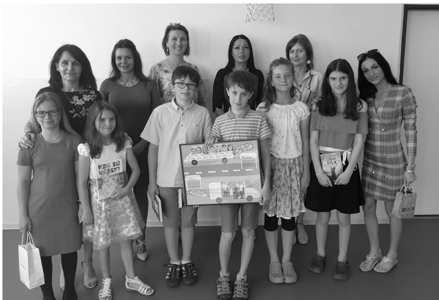
Lúčiaci sa štvrtáci s pani učiteľkami

Skončil sa teda školský rok 2019/2020, bol iný, ako tie predošlé, a dúfame, že sa už nebude opakovať! Chcem sa poďakovať žiakom a ich rodičom, že zvládli túto mimoriadnu si-