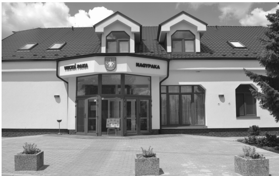
V rámci obnovy kultúrneho domu sa vybudovali bezbarierové prístupy

V prvom prípade sa jednalo o zníženie energetickej náročnosti verejných budov, kde sa v rámci projektu na administratívnej budove, v ktorej sídli pošta zateplili steny, pribudla