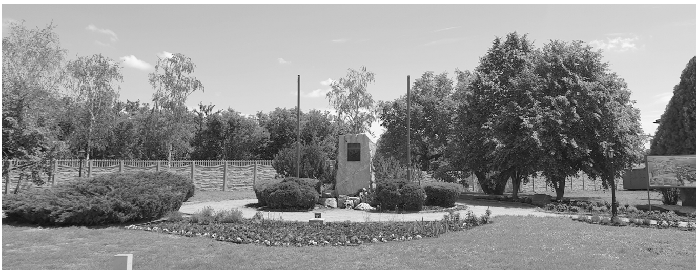
Park pri pošte