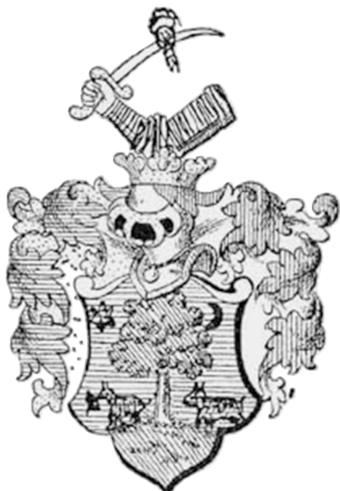
A Földes család címere

Földes Gyula négy évig a pozsonyi gimnáziumba járt, retorikát és poézist Nagyszombatban, bölceletet és jogot Pozsonyban tanult. A magyar forradalom és szabadságharc idején, 1848 szeptemberében a Pozsony megyei önkéntesek közé, októberben pedig a 15. honvédszászlóaljba állt, s csak 1849. augusztus 13-án Világosnál, Görgey vezényletére tette le a fegyvert honvédtársaival egyetemben. Az osztrák hadseregbe sorozták, de kolerával agynak esett. Fölépülése után az akkori Csanád vármegyében bujkált, egészen 1850 decemberéig. Minden valószínűséggel az ottani zsidók vették oltalmukba, s az irántuk érzett kegyeletből haláláig hatalmas fehér rabbiszakállat viselt.