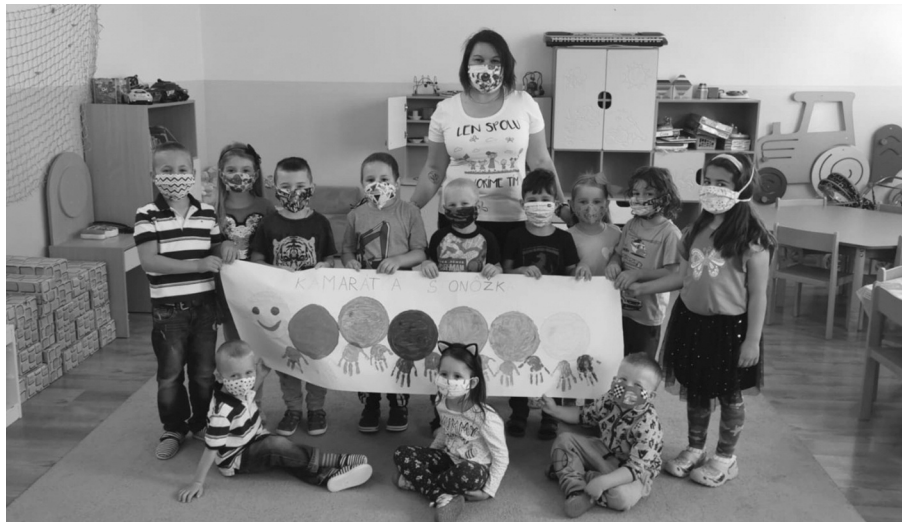
Na tvárach sa objavili ochranné rúška...

Naproti tomu naša redakcia je presvedčená o tom, že: áno, je dôležité, aby sme udalosti zrekapitulovali a spoločne opísali ako sme prežili toto