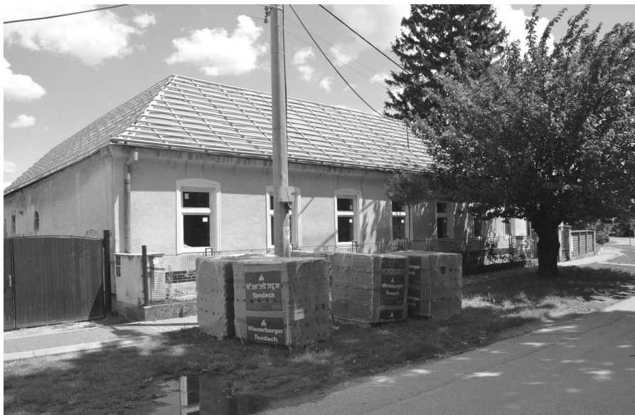
Rekonštrukcia fary vo Veľkej Pake

Ďalej sa prijalo nové VZN č. 3/2020 na stanovenie poplatkov v MŠ a ŠKD.