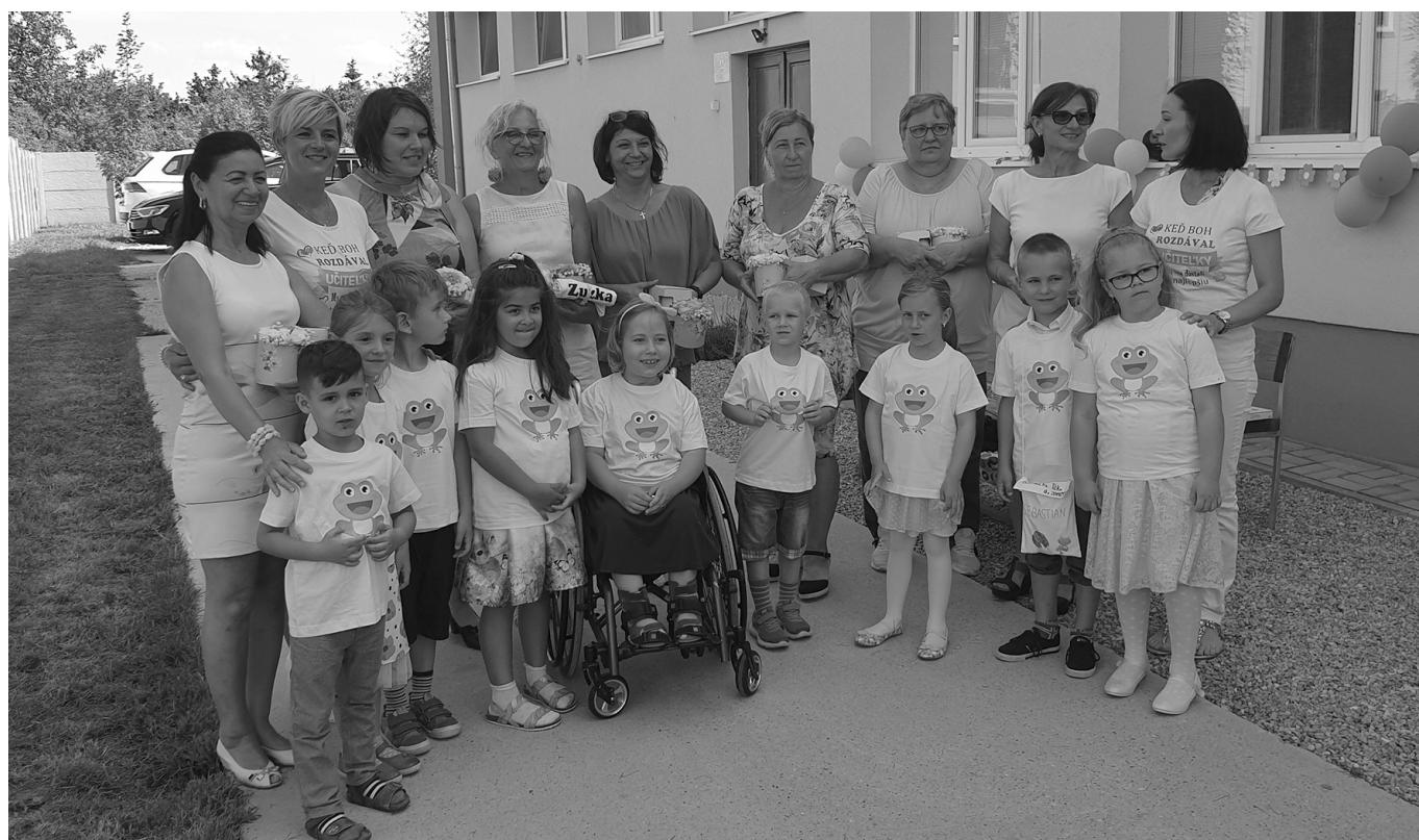
Budúci prváčikovia s kolektívom pracovníčok v MŠ