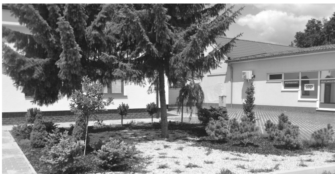
Revitalizovaný park a parkovisko pri kultúrnom dome