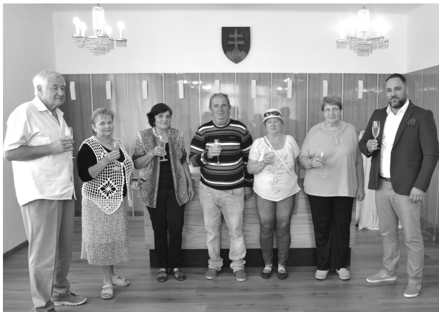
Ďalší oslávenci so starostom obce

úsekoch majú byť začaté v najbližších dňoch, ukončené by mali byť koncom júla 2018. Náklady činia spolu 90 000 eur, pritom dotácie z Enviromentálneho fondu túto zložku vykrývajú vo výške cca 61 000 eur. Obecné zastupiteľstvo schválilo ostatnú časť financií doplniť z rozpočtu obce za kalendárny rok. Žiaľ, ďalšie naše žiadosti boli zatiaľ zamietnuté. Jedná sa o obnovu detského ihriska vo Veľkej Pake, o výstavbu tribúny na futbalovom štadióne, ako aj o rekonštrukciu šatní, a o dotácie na usporiadanie niektorých našich plánovaných kultúrno-spoločenských akcií. Očakávame pritom opätovné vyhlásenie výzvy príslušných orgánov na výstavbu chodníkov, do ktorej by sme sa opäť radi zapojili ohľadom na všetky historické časti obce. Zdôrazňujem však, že všetky naše plánované investičné zámery sú závislé od schválenia už spomínanej dotácie na filtračné zariadenie obecného vodovodu, lebo v prípade neakceptovania našej žiadosti Envirofondom, náklady budeme musieť vykryť z vlastných obecných zdrojov.