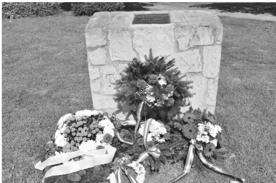
Na aprílovom Pamätnom dni vystávaných maďarov z Hornej Zeme vo Vaskúte sa zúčastnila aj delegácia obce Veľká Paka

• Čiastočne máme schválenú dotáciu na rekonštrukciu a rozšírenie kanalizačnej stokovej siete v časti Čukárska Paka a Malá Paka. Práce na týchto