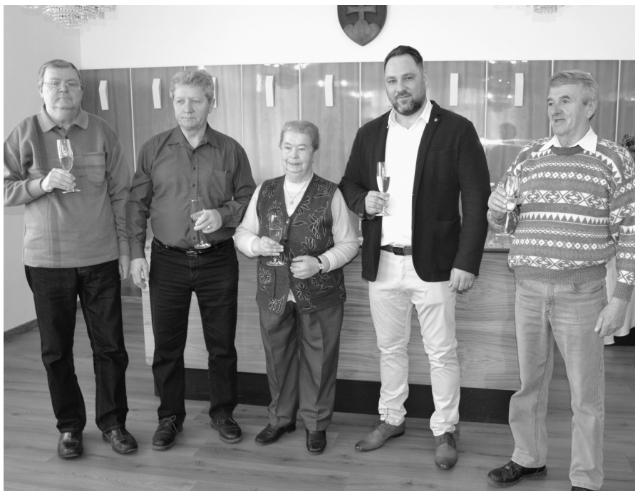
Slávnostné privítanie jubilantov na obecnom úrade

A platí ešte Rozhodnutie Regionálneho úradu verejného zdravotníctva Dunajská Streda o zákaze používať pitnú vodu v obci za určitých konkrétnych okolností? (Plné znenie Rozhodnutia... sme uverejnili v marcovom vydaní Novín Veľkej Paky – Pozn. red.)