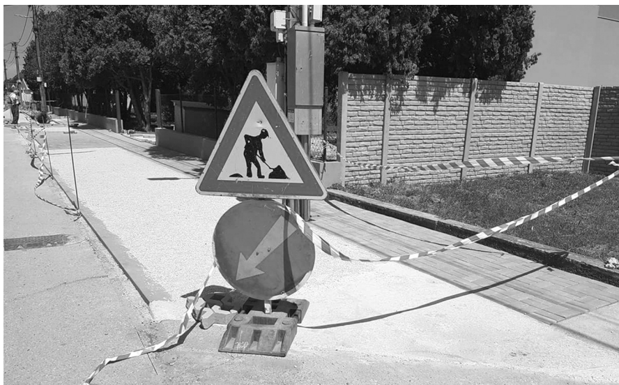
Na jar sa uskutočnila úprava okolia budovy a areálu ZŠ a MŠ