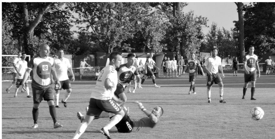
Veľká Paka–Sap (v bielom drese) 1:3

VELKÁ PAKA–OKOČ–OPATOVSKÝ SOKOLEC 4:4 (2:0), g.: