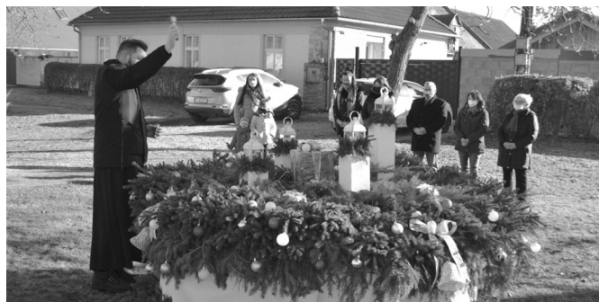
Adventný veniec v Čukárskej Pake

V tomto roku je pre mňa vodidlom modlitba anjela Pána – anjel osloví Máriu, že práve Ona porodí Spasiteľa. Pripravujem sa na túto tému štúdiom rôznych písomných zdrojov, kníh, a medzitým sa sústreďujem aj na pôst – pokrm, nápoj. Intenzívnejšie sa venujem spovediam, obozretnosti a kázňam. Spovede sú v tejto dobe ešte osobnejšie