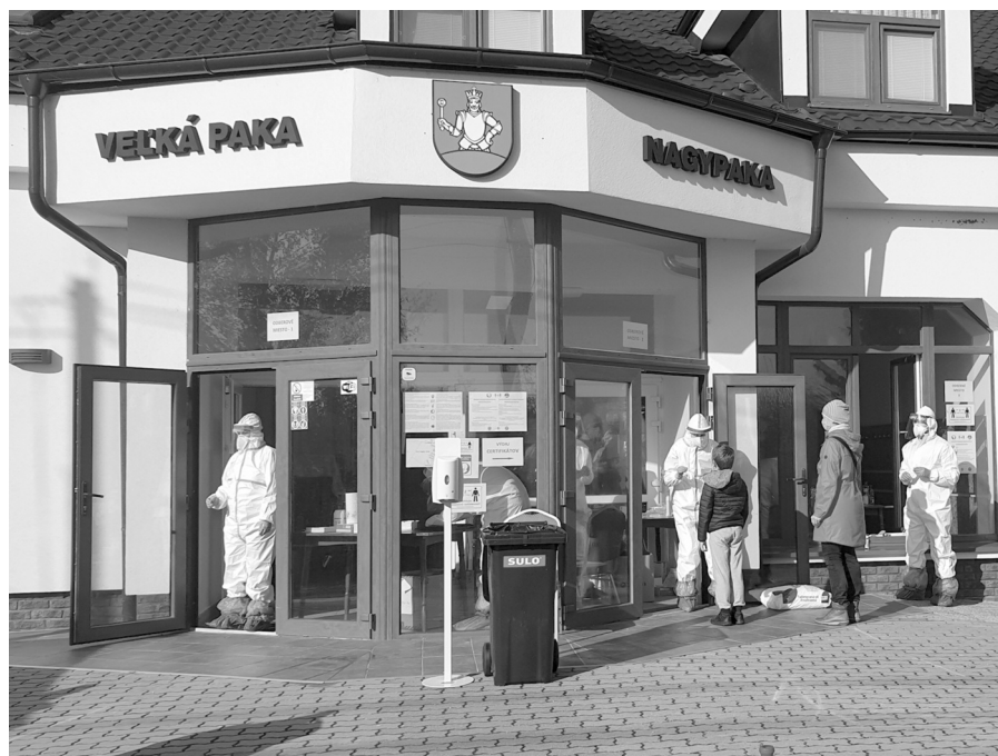
Kultúrny dom počas testovania

Momentálna situácia je veľmi zložitá a náročná. Pedagogičky sa snažia s maximálnym vypätím síl zabezpečiť výchovno-vyučovací proces v našej škole a škôlke, žiaľ nedá sa predpokladať, kedy opäť niekto ochorie. Najjednoduchšie by bolo zavrieť školu a škôlku, toto ale nie je našim cieľom. Uvedomujeme si, že návšteva školských a predškolských zariadení je pre rozvoj detí veľmi dôležitá. Urobíme preto všetko, aby tomu tak mohlo byť. Zároveň týmto žiadame rodičov, aby dôsledne sledovali zdra-