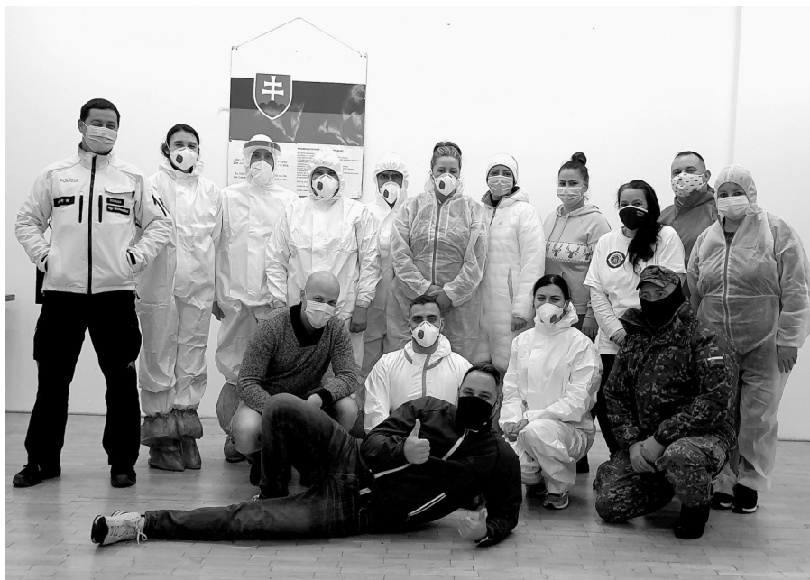
Testovací tím v II. kole