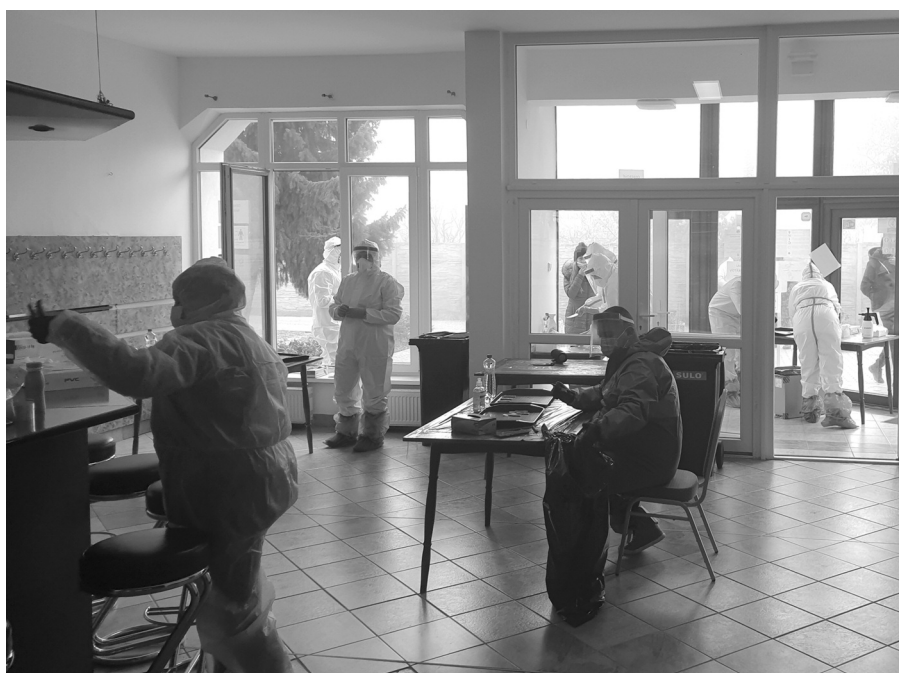
Testovací tím pri práci

Úcta k starším ľuďom by mala byť predovšetkým prirodzenou súčasťou nášho života, mala by byť spontánna a nenásilná. Úcta k tým, ktorí tvrdo pracovali, aby sa nám žilo lepšie. Úcta k tým, ktorí sa každý deň vzdávali radostí, ktoré im život ponúkal, aby urobili šťastnými nás, ich deti.