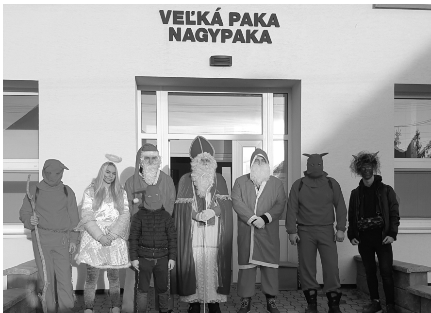
Mikulášsky sprievod tvorili členovia Dobrovoľného hasičského zboru Vel'ká Paka

V tento sviatočný čas chceme byť dobrí k sebe navzájom, chceme každému rozdávať len radosť. Vianoce sú obdobím, keď sa každý snaží byť s blízkymi, keď si uvedomujeme silu priateľstva, lásky, úcty a obetavosti. Pre každého z nás je dôležité, aby sa