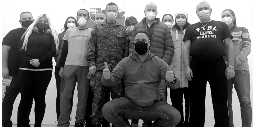
Testovací tím v I. kole

Starosta obce oznámil, že obec zavedie pilotný projekt zberu kuchynského odpadu. Tento rok budú umiestnené v obci štyri nádoby, ktorých počet sa podľa potreby môže